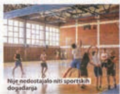
Nije nedostajalo ni sportskih događanja