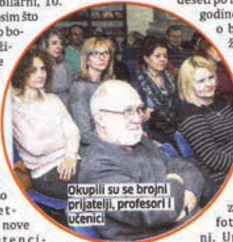
Okupili su se brojni prijatelji, profesori i učenici