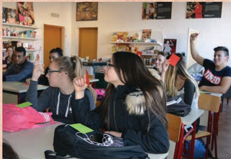
Učenici 2. d

Uspinjali se kao razred i padali, Bili zločesti pa stradali, Maha si davali, Za dvojku odgovarali, Neopravdane sate nismo opravdavali, Sjedili u zadnjoj klupi, Nismo ispali glupi, Živjeli smo samo za taj dan, Kad je bio šuplji, Složni uvijek bili, Od profesora se nikad nismo krili, Samo makijato pili, Pa uvijek živi bili, I znat će cijela zbornica Da dobar je to filing.