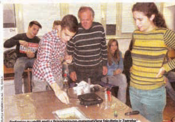
Radionicu su vodili gosti s Prirodoslovno-matematičkog fakulteta iz Zagreba