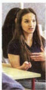
Budući mladi edukatori savjetovat će svoje vršnjake

Da je tema o nasilju više nego dobro pogodena, dokazali su budući bjelovarski edukatori, koji su svaku problemsku priču aktivno promišljali sa svih strana