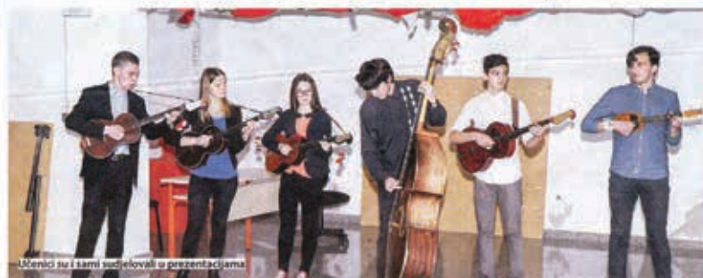
Učenici su i sami sudjelovali u prezentacijama

Učenici i zaposlenici Komercijalne i trgovačke škole su tijekom obilježili Dan škole, i to na sam Međunarodni dan zaštite potrošača. Tim povodom u školi je održano dvadesetak zanimljivih predavanja i radionica, na kojima su učenici mogli sudjelovati prema vlastitom izboru. I dok u školskoj redovnoj nastavi učenici Komercijalne i trgovačke škole stručne predavanja, vezane uz njihova buduća zanimanja, teme posuđene za Dan škole obično su ležernije i nevezane uz trgovinu i ekonomiju. Tako su ovega puta školari slušali putopisna predavanja o Kini i Albaniji, imali radionice o fotografiji, imenikama, izradi letaka i oglašavanja, prezentirali im je sportsko pjevanje, čuli su zanimljive detalje o sortiranju otpada, svakodnevici sljapih osoba i sl.