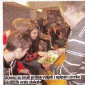
Učenici su imali priliku vidjeti i opipati uzorke različitih vrsta stakla

U školskoj knjižnici Komercijalne i trgovačke škole Bjelovar prije nekoliko dana održana zanimljiva radionica pod nazivom Tajne stakla. Bila je namijenjena učenicima trećih razreda koji u okviru predmeta Poznavanje rube slušaju sadržaje o staklu. Radionicu su vodili gosti s Prirodoslovno-matematičkog fakulteta iz Zagreba, Marina Čalogović koja pobuda postojedi i opipati uzorke različitih vrsta prirodnih i umjetnih stakala.