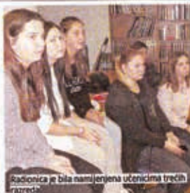
Radionica je bila namijenjena učenicima trećih razreda