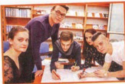
Projektne zadaci odrađivali su se u grupama