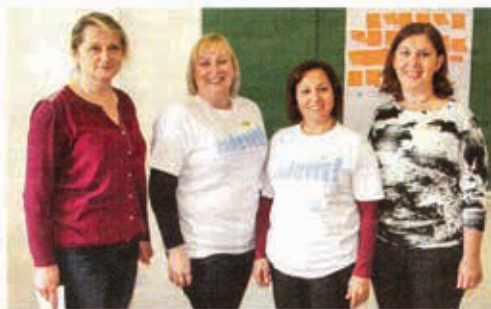
Stručni tim običi će sve bjelovarske srednje škole

Školu u adolescencijalnim vezama provela u vrijeme posno razmatranje u bjelovarskoj Komercijalnoj i trgovačkoj školi. Ukupno 25 učenika iz šest bjelovarskih srednjih škola educiralo se na tu temu, kako bi promogli svojim vršnjacima da na vrijeme istjegu nasilje u vezama. U istraživanju koje je prije nekoliko godina proveo Centar za edu-