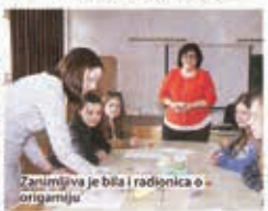
Zanimljiva je bila i radionica o origamiju