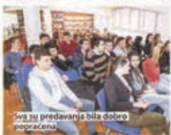
Sva su predavanja bila dobro popraćena